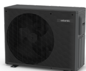
UE MURAO DESIGN NOIR